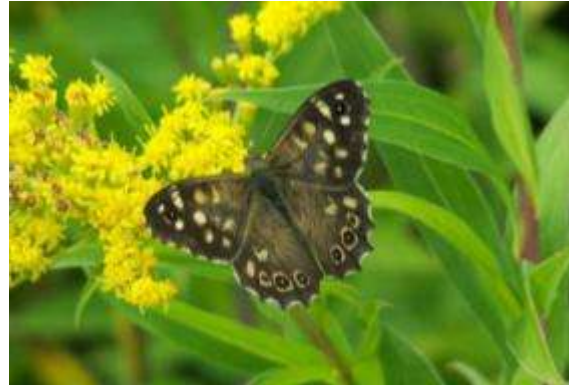
Tweede prijs: Bont zandoogje