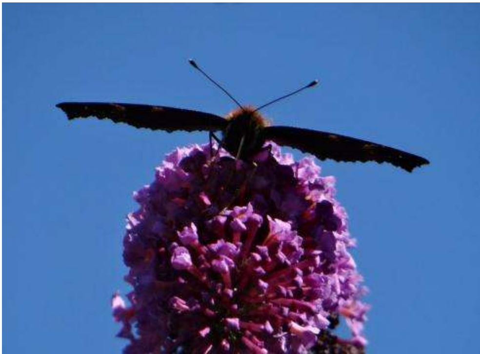
1 e prijs: Dagnauwoog