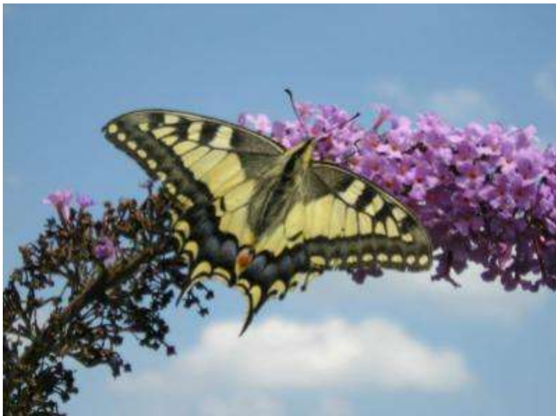
3 e prijs: Koninginnenpage