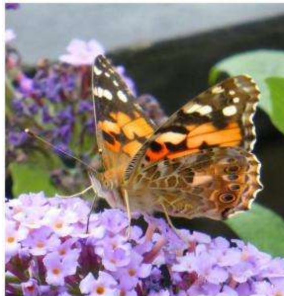
4 e prijs: Distelvlinder